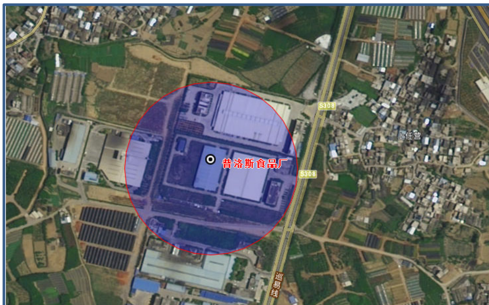
图 4-1 项目卫生防护距离示意图

根据卫生防护距离计算结果，本项目卫生防护距离设定：即以本项目板油炼制区边界外延 50m 的范围作为卫生防护距离。根据现场踏勘，项目卫生防护距离内无居民点、学校、医院等敏感目标，因此项目的选址符合卫生防护距离要求。